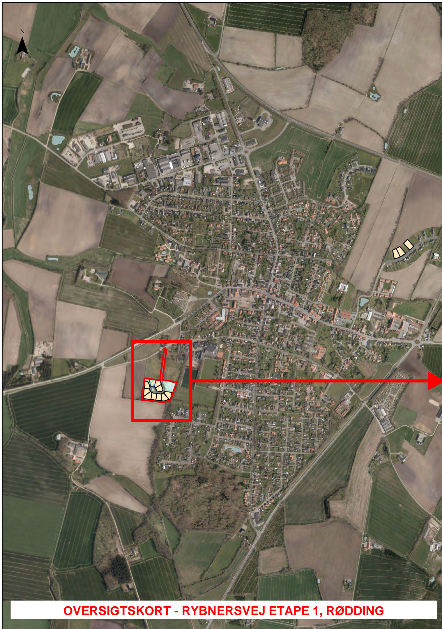
OVERSIGTSKORT - RYBNEVSVEJ ETAPE 1, RØDDING